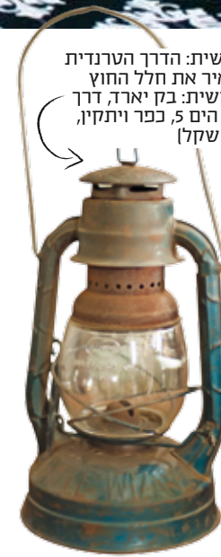
עשית: הדרך הטרנדית להאיר את חלל החוץ (עשית: בקי יארד, דרך מול הים 5, כפר ויתקין, 195 שקל)

"הבדים שמותאמים לתנאי חוץ לרוב יקרים מאוד, וגם הם בסופו של דבר דוהים. בעיניי לא שווה להשקיע בהם כל כך הרבה כסף. אני מעדיפה להשתמש בטקסטיל זול יותר, שאינו מיועד דווקא לחלל החוץ, ולהחליף אותו בתדירות גבוהה"