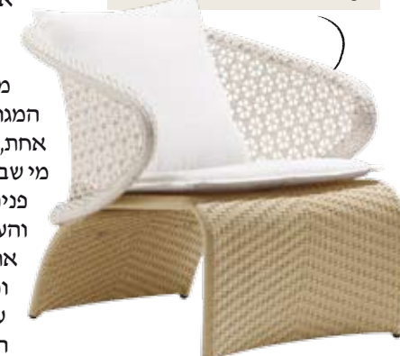
להשקיע או לא להשקיע בריהוט החוץ? זאת השאלה (כורסה: רשת IDdesign, 3,300 שקל)

על המרפסת, בגג או בגינה - מי שיש בביתו חלל חוץ פרטי יודע שזה המקום המושלם להתרווח או לארח בו בחודשי הקיץ. דווקא עכשיו, כשהעונות מראות אי אלו סימני התחלפות, נעים אפילו יותר לשבת בחוץ. אז איך הופכים את חדר המגורים החיצוני למעוצב ומזמין לא פחות מהפנימי, למרות האתגרים שמציבה הסיבה נטולת הקירות? "בתנאי מזג האוויר הנפלאים בארץ, הגינה וחוף הבניין הופכים להיות מקום אקטיבי ואינטנסיבי", אומר אדריכל דובי וויט . "בתכנון בתים צמודי קרקע אנחנו מנסים להפוך את מבנה המגורים והחוץ ליחידה אינטגרלית אחת, כך שמי שנמצא בבית רואה את מי שבגינה. הקשר ההדוק הזה בין פנים לחוץ משפיע מאוד על התכנון והעיצוב של הגינה. החוץ ממשיך את החלל, שמתחיל בתוך הבית, ומשלים אותו. הוא איננו יחידת עיצוב עצמאית, אלא רצף המשכי של חומר או אלמנטים,