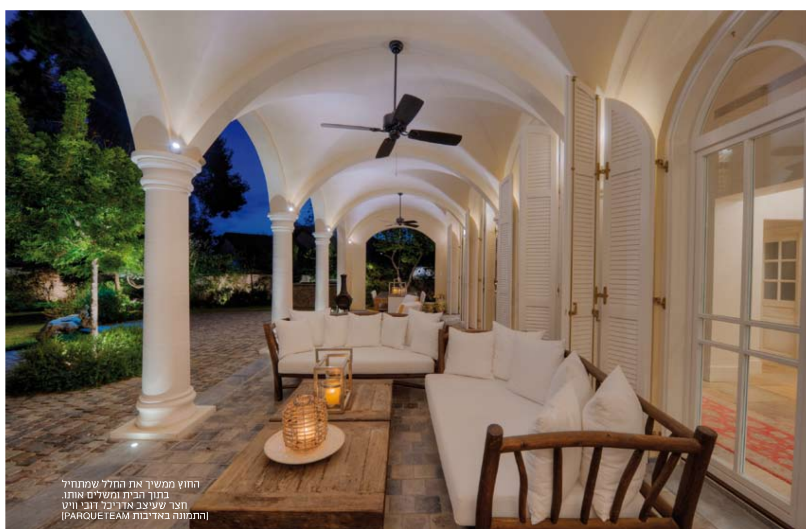
החוץ ממשיך את החלל שמתחיל בתוך הבית ומשלים אותו. חצר שעיצב אדריכל דובי וויט

"המגמה העכשווית בתחום ריהוט החוץ מתייחסת לריהוט הגן כאל ריהוט פנים לכל דבר מבחינת העיצוב, האיכות, הנוחות והצבעוניות"