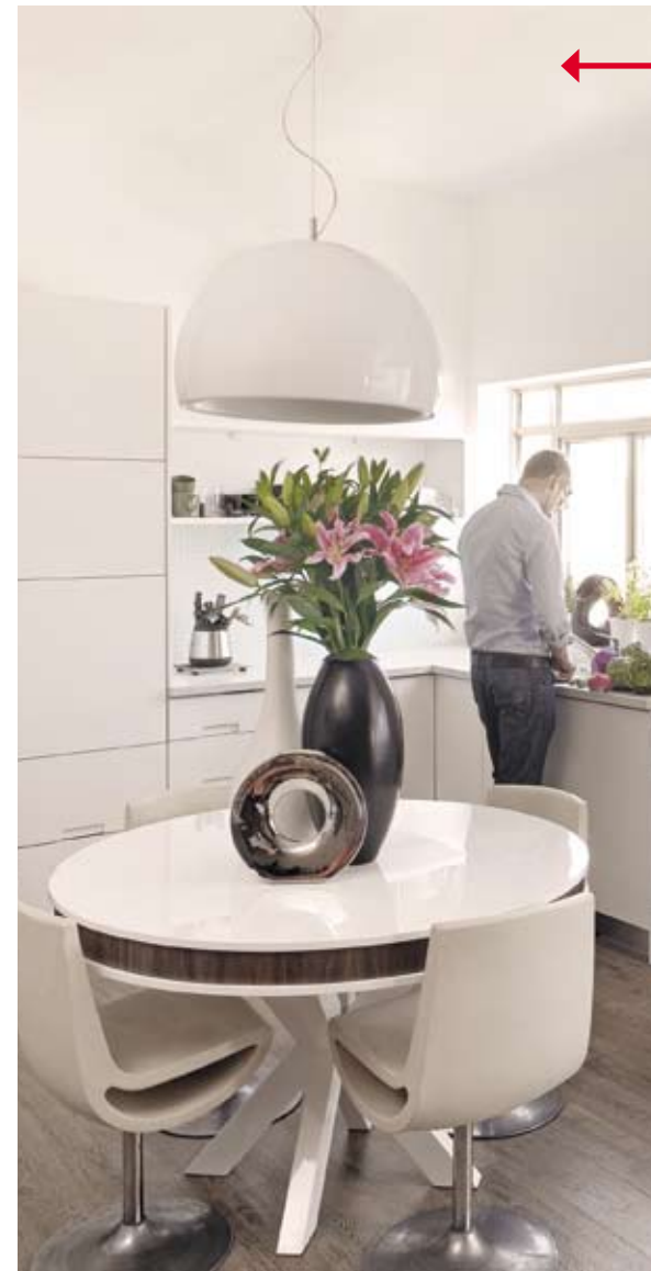
איפה משיגים את הפריטים? עברי לעמוד 160