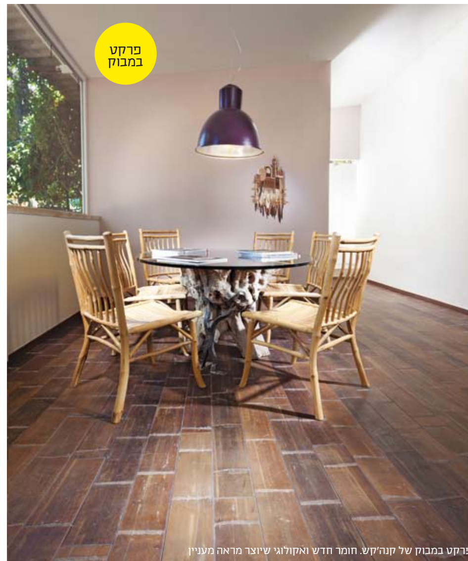
פרקט במבוק של קנה'קש. חומר חדש ואקולוגי שיוצר מראה מעניין