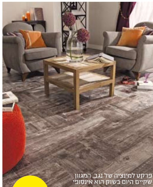
פרקט למינציה של נגב. המגוון שקיים היום בשוק הוא אינסופי