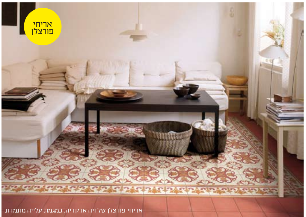
אריחי פורצלן של ויה ארקדיה. במגמת עלייה מתמדת

גימור כזה, בגוון מסקאלת הלבנים, ישתלב היטב עם המראה הטבעי של העץ ויעניק לחלל שלכם אווירה מעוצבת במיוחד."