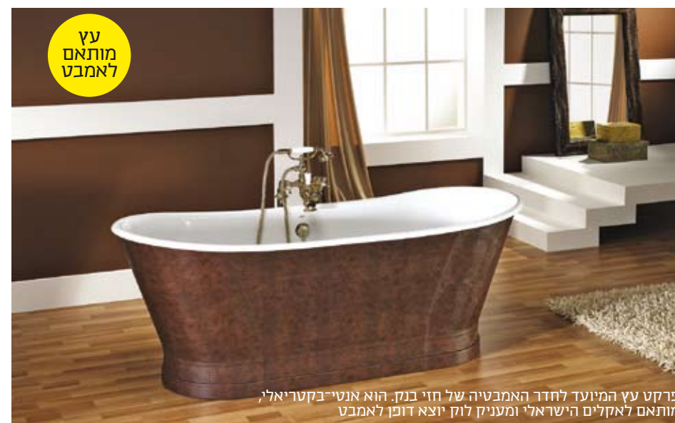
פרקט עץ המיועד לחדר האמבטיה של חזי בנק. הוא אנטי-בקטריאלי, מותאם לאקלים הישראלי ומעניק לוק יוצא דופן לאמבט

מהווים כ-90 אחוז מסך הריצוף, ואילו בארץ הגיוון רב יותר ויש שימוש ניכר בחומרים כגון אבן, צפחה ושיש."